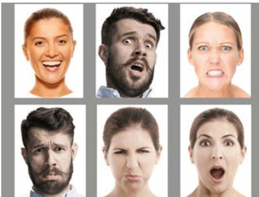
Fot. 1. Emocje podstawowe